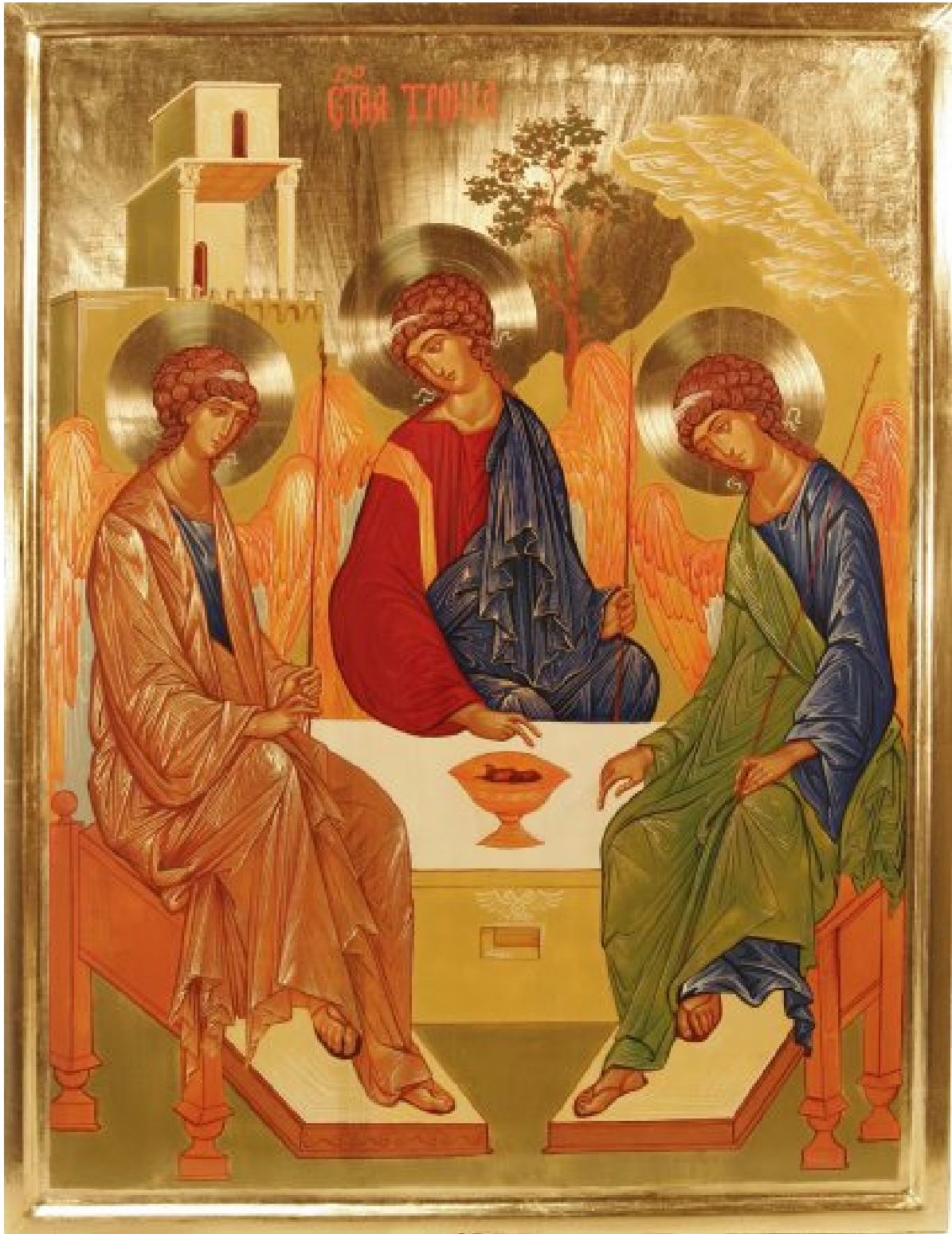
Icona de la Trinitat. Andrei Rublev (1360-1428)