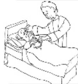
UNCIÓ DELS MALALTS