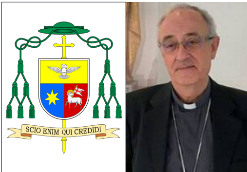
Salvador Cristau Coll, Bisbe de Terrassa