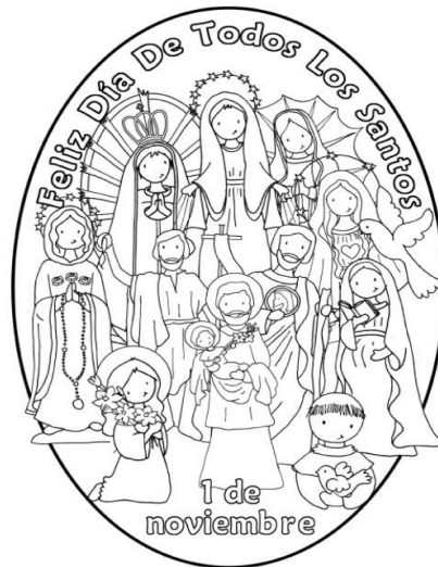
Làmina per pintar, Festa de tots Sants.