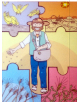
Fitxa sobre la paràbola del sembrador

SORTOSOS ELS QUI ESCOLTEN LA PARAU- LA DE DÉU I LA GUAR- DEN